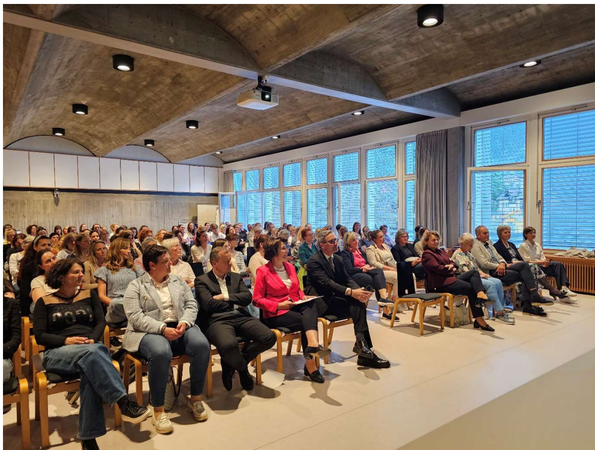
Vollversammlung am 11.04.2025

Die Mitglieder arbeiten das ganze Jahr aktiv mit und bringen sich mit Ideen, Anregungen und Verbesserungsvorschlägen ein. Im Laufe des Jahres finden mehrere organisatorische Erfahrungsaustausche sowie Videokonferenzen mit den arbeitenden Mitgliedern statt, so ist eine vernetzte und partizipative Kommunikation gewährleistet.