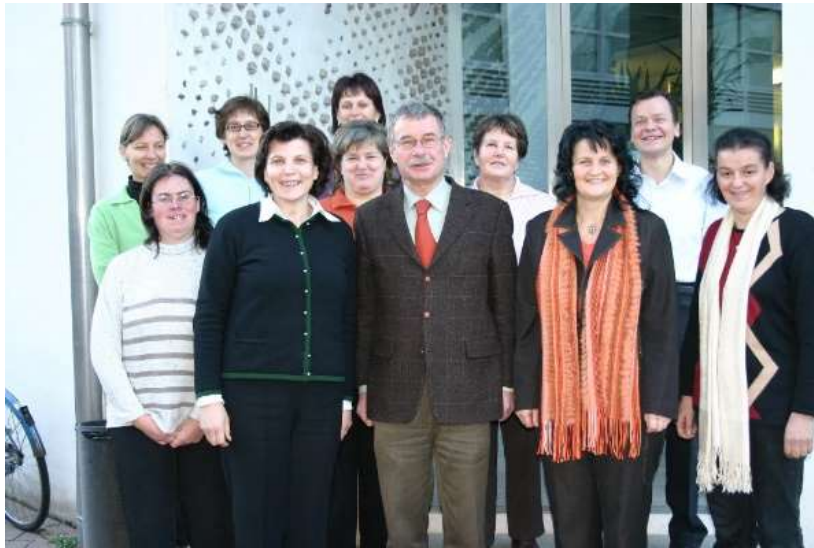
Gründungsmitglieder der Sozialgenossenschaft Mit Bäuerinnen lernen wachsen leben

unseres Lebens. sie ist eine alte Kulturpflanze und untrennbar mit der bäuerlichen Kultur, mit Brauchtum und Festtagen, sowie mit der traditionelle Küche verbunden. Die Dienstleistungen der Sozialgenossenschaft sind werteorientiert.